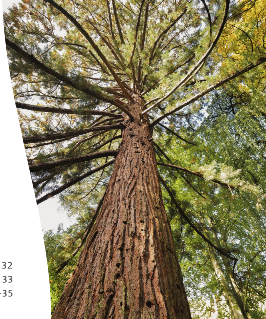
Unser über 100 Jahre alter Mammutbaum